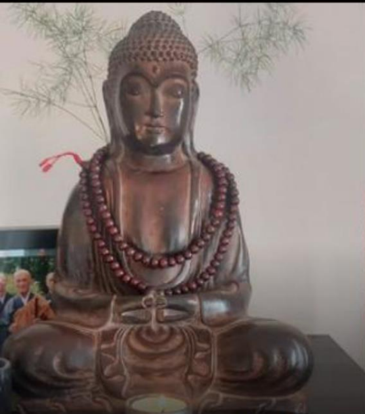
nemen van een overledene et zenboeddhisme ELEN EN SOCIALE GEBRUIKEN