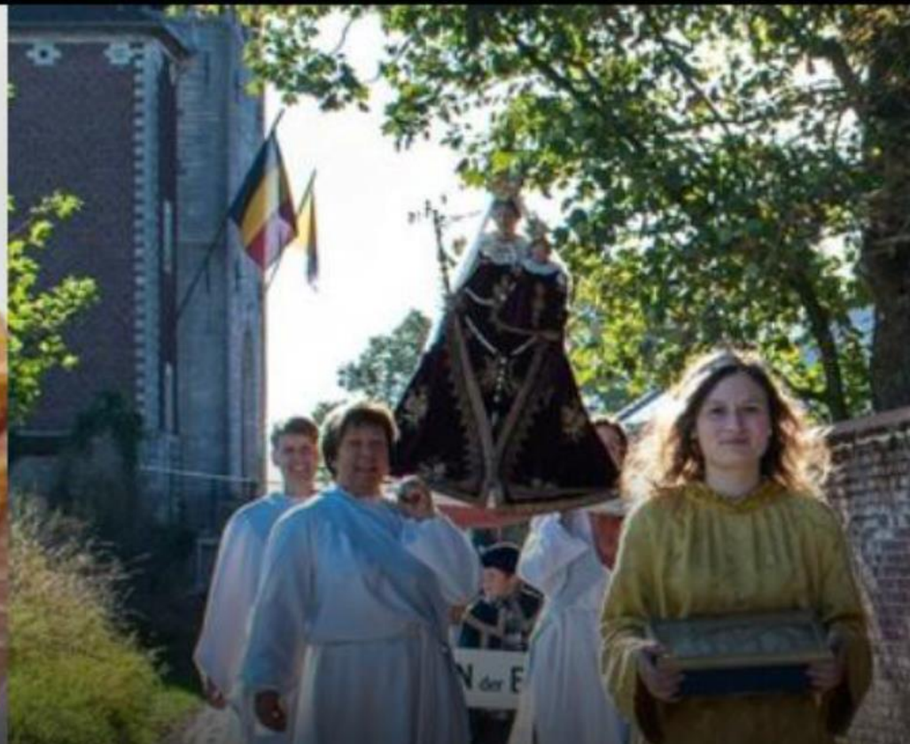
Sint-Martinusprocessie Kerkom FEESTEN, RITUELEN EN SOCIALE GEBRUIKEN