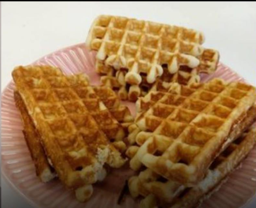
Wafels als verjaardagstraktatie FEESTEN, RITUELEN EN SOCIALE GEBRUIKEN, ETEN EN DRINKEN