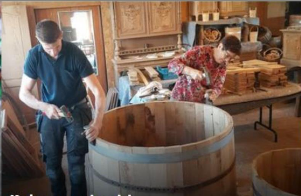
Kuipersambacht VERTELLEN EN TAALGEBRUIK , NATUUR EN LANDBOUW, ETEN EN DRINKEN, AMBACHT, VAKMANSCHAP EN TECHNIEK