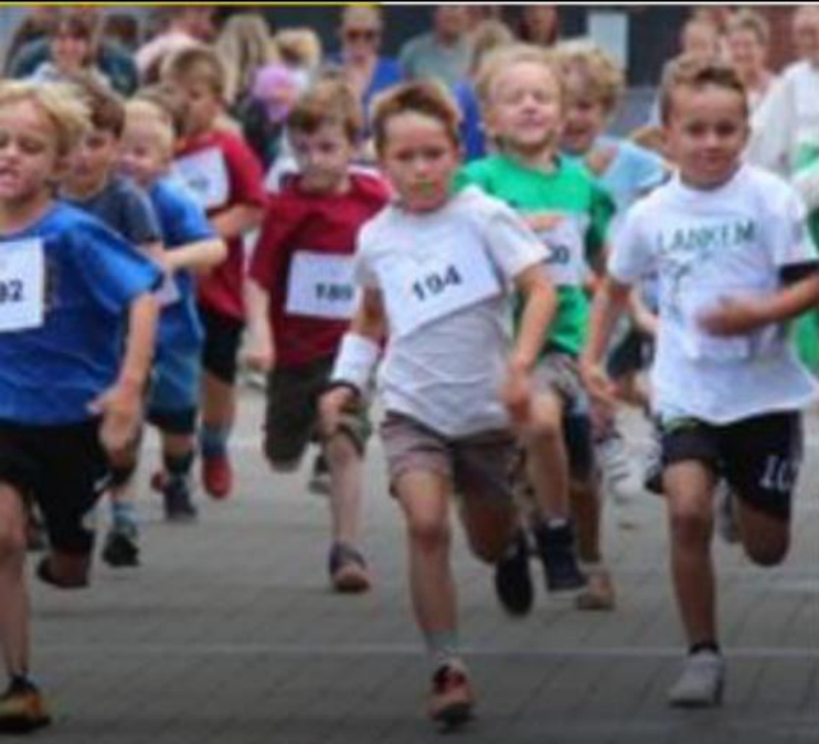
van Noorderwijk ELEN EN SOCIALE GEBRUIKEN, SPORT EN