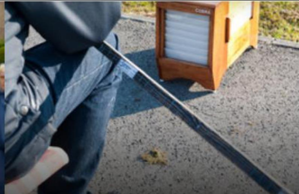
Vinkenzetten in Vlaanderen SPORT EN SPEL