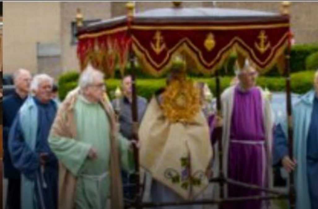
Sacramentsprocessie Veldwezelt FEESTEN, RITUELEN EN SOCIALE GEBRUIKEN